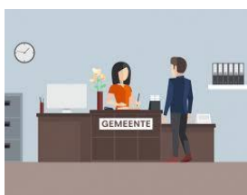
Kan ik hier een sekswerkvergunning aanvragen?

Dat vergunnen lijkt voor menig buitenstaander toch vast een heel goede oplossing, maar men moet zich ook bedenken dat het uitgeven van een vergunning door gemeenten is gebonden aan een aantal voorwaarden: de Gemeente moet een aanvraag, die men dan wil honoreren ook publiceren, daarop is beroep mogelijk door belanghebbenden (meestal omwonenden) bij de beroepscommissie; als dat geen oplossing is gaat de zaak naar de Raad van State... Leve de privacy van de sekswerker die daarna nooit haar klant meer 'in de privésfeer' kan ontvangen: de hele buurt is op de hoogte en wie weet ook alle krantenlezers! En van Internet krijg je het dan ook nooit meer af – ook niet als de vergunning uiteindelijk niet wordt verstrekt... misschien goed voor een lijkt extra krantenberichtje?).