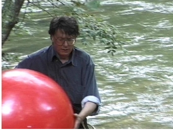
Roman Signer (Appenzell, 19 mei 1938)

is een Zwitserse beeldhouwer en tekenaar. Hij is vooral bekend geworden door zijn installatie- en conceptuele kunst, alsmede foto-, film- en videokunst.