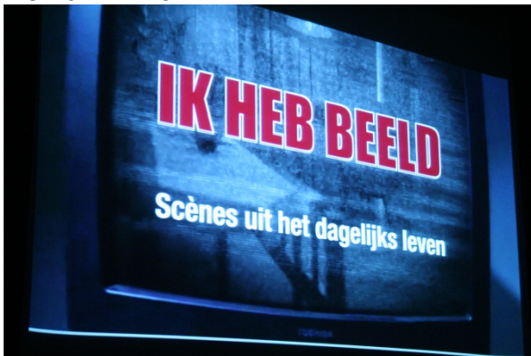
Beeld uit ckv presentatie klas 4 havo en vwo 2011

Ik vind dat ckv een verplicht examenonderdeel moet blijven, want creatieve kinderen moeten ook een kans krijgen om dit goed te kunnen ontwikkelen. Bovendien hebben wij als kinderen ook praktisch nodig om onze energie kwijt te kunnen, in plaats van alleen maar achter de boeken te zitten. Verder leer je bij ckv veel over sociale vaardigheden en krijg ik er persoonlijk veel meer zelfvertrouwen van wat mij heel erg helpt in het dagelijks leven. Charlotte van Die