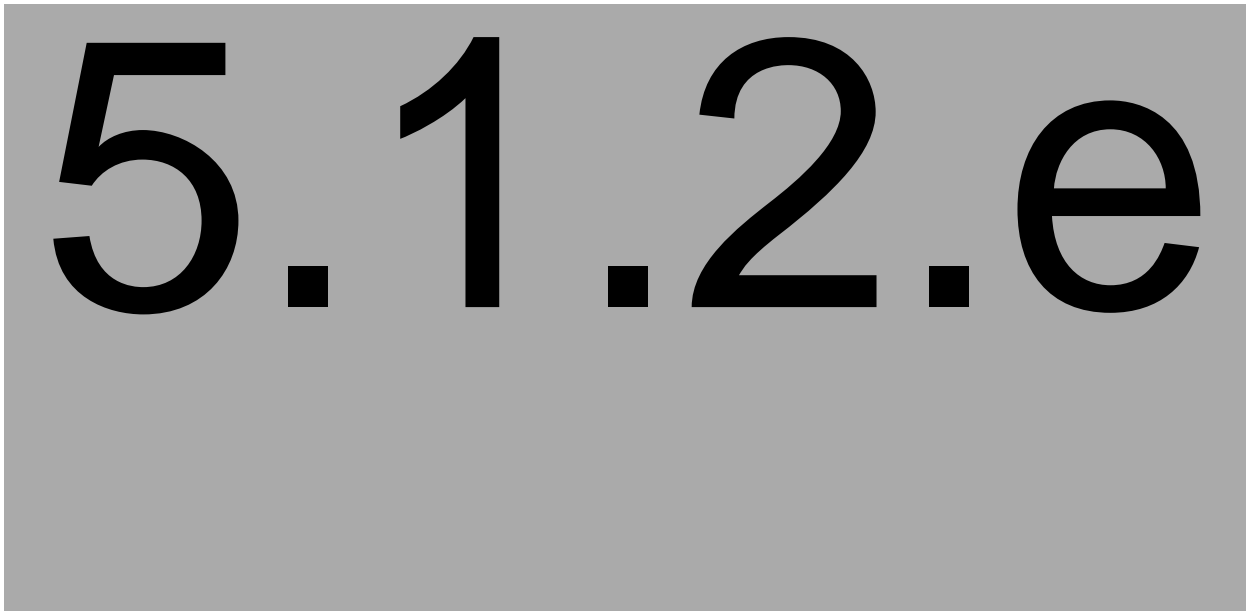
Figuur 1 Voorbeeld van de bemonstering (blauwe lijnen) door Unitura met een roller op de potentiële in- en uitvliegopeningen van een woning. Links: voorgevel; rechts: kopgevel. Adres: 5.1.2.e , Zuidhorn.

Resultaten met uitkomst 'Inconclusive' (SGS) zijn opgevat als negatief (onvoldoende bewijs voor aanwezigheid van vleermuizen). Het onderzoek is blind uitgevoerd. Dit betekent dat de onderzoekers van de verschillende onderzoeksmethoden geen inzicht hebben gekregen in de onderzoeksresultaten tijdens het veldonderzoek. Hiermee is voorkomen dat de resultaten onderling zijn beïnvloed. De overeenkomsten tussen de methoden is getest met de McNemar-test voor 2x2 contingency-tabellen uit het python-pakket Statsmodels.