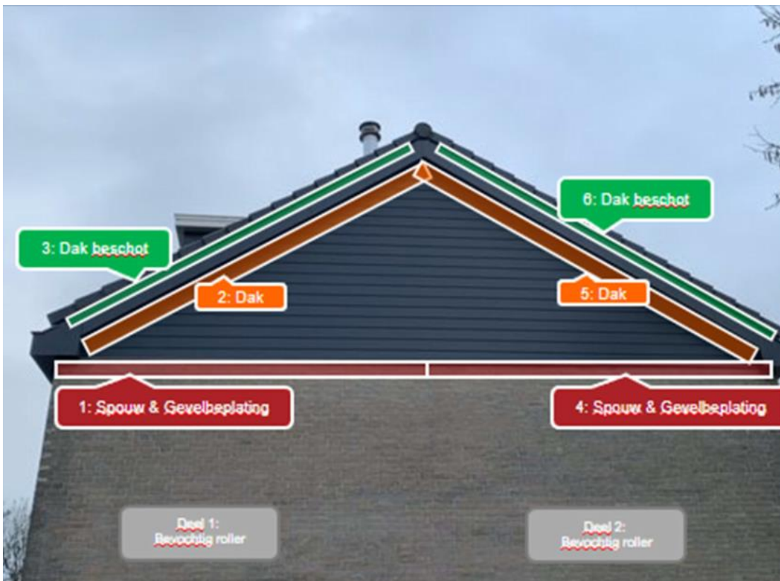
Figuur 3 Voorbeeld van monstername-plaatsen op de gevel van een grondgebonden woning.