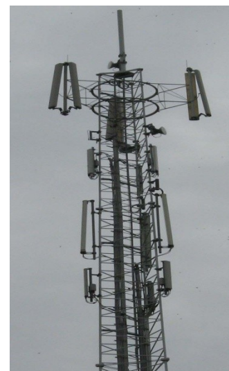
Het "digitale" asbest van Nu

Als stichting hebben ons al lange tijd verdiept in onder andere de effecten voor de Volksgezondheid bij de gehele uitrol van de 5G technologie. Welke een stapeling gaat vormen met de reeds aanwezige frequenties, waaronder WiFi, 4G enz.