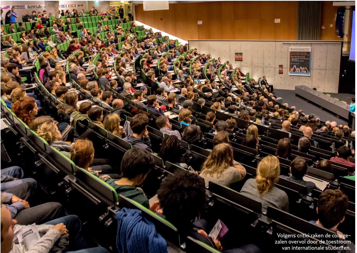
Volgens critici raken de collegezalen overvol door de toestroom van internationale studenten.

Fries financieren. Het Frysk heeft een status als tweede rijkstaal en dient als zodanig behouden te blijven.' Maar hij vermoedt dat de kleine studie Fries, die maar een handvol studenten trekt, niet past in het opschalings- en verzakelijingsbeleid van de RUG.