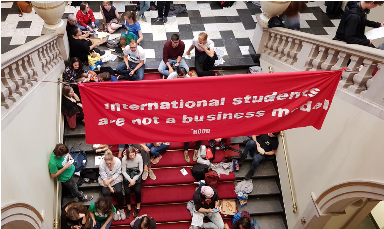
Studenten bezetten het Academiegebouw van de RUG. Ze eisen betere huisvesting voor internationale studenten. 6 september 2018.

de overweldigende toestroom van internationale studenten. Werkgroepen puilen uit.