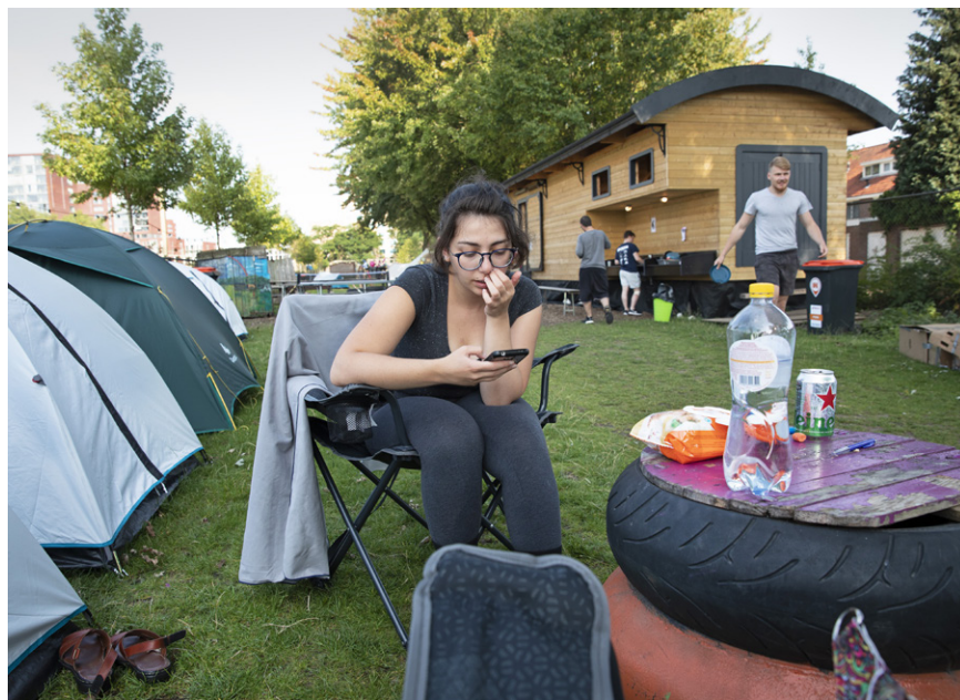
Eerstejaarsstudenten van Tilburg University wonen op een camping, omdat de stad niet genoeg studentenwoningen heeft. 22 augustus 2019.