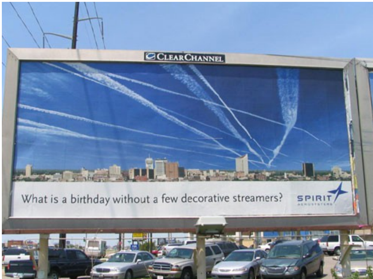
Billboards langs de weg in de V.S.