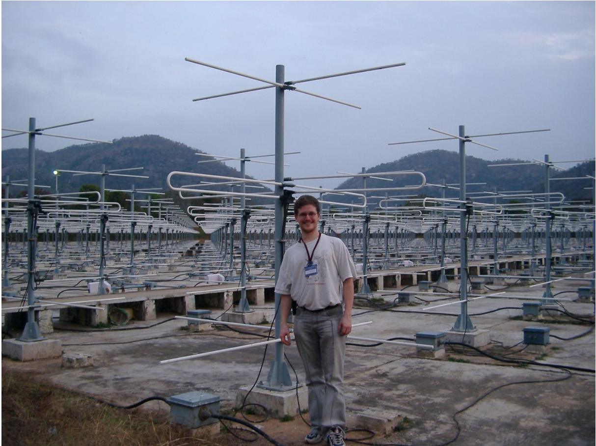
h.a.a.r.p.-installatie zuid-India, kunstmatig gevormde bewolking