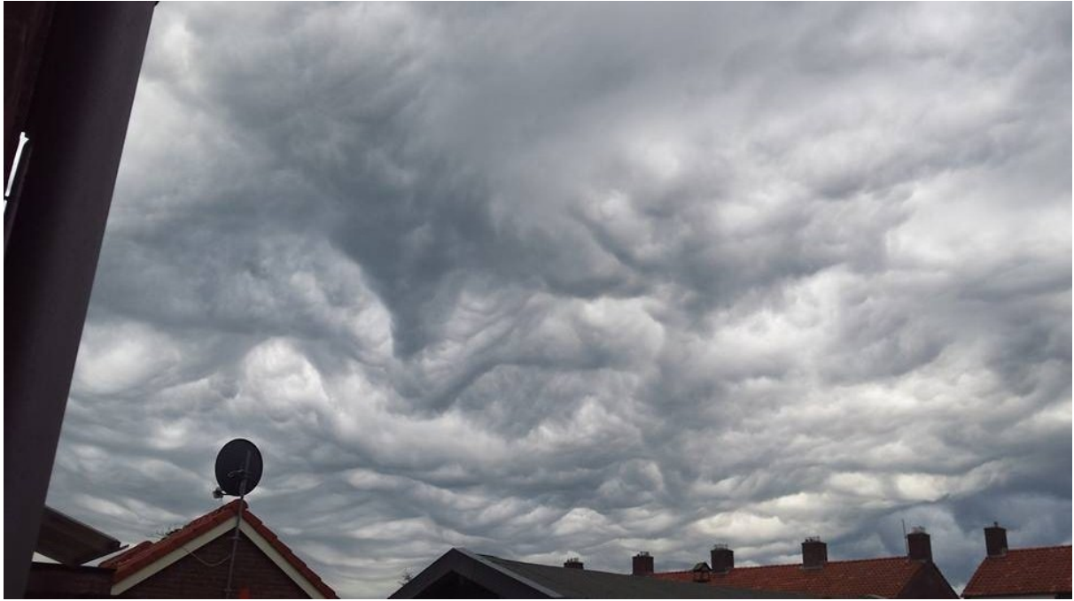
H.a.a.r.p.-bewolking boven Nederland, zomer 2015. Dit is dus géén nieuwe wolkensoort, zoals ons voorgelogen wordt.