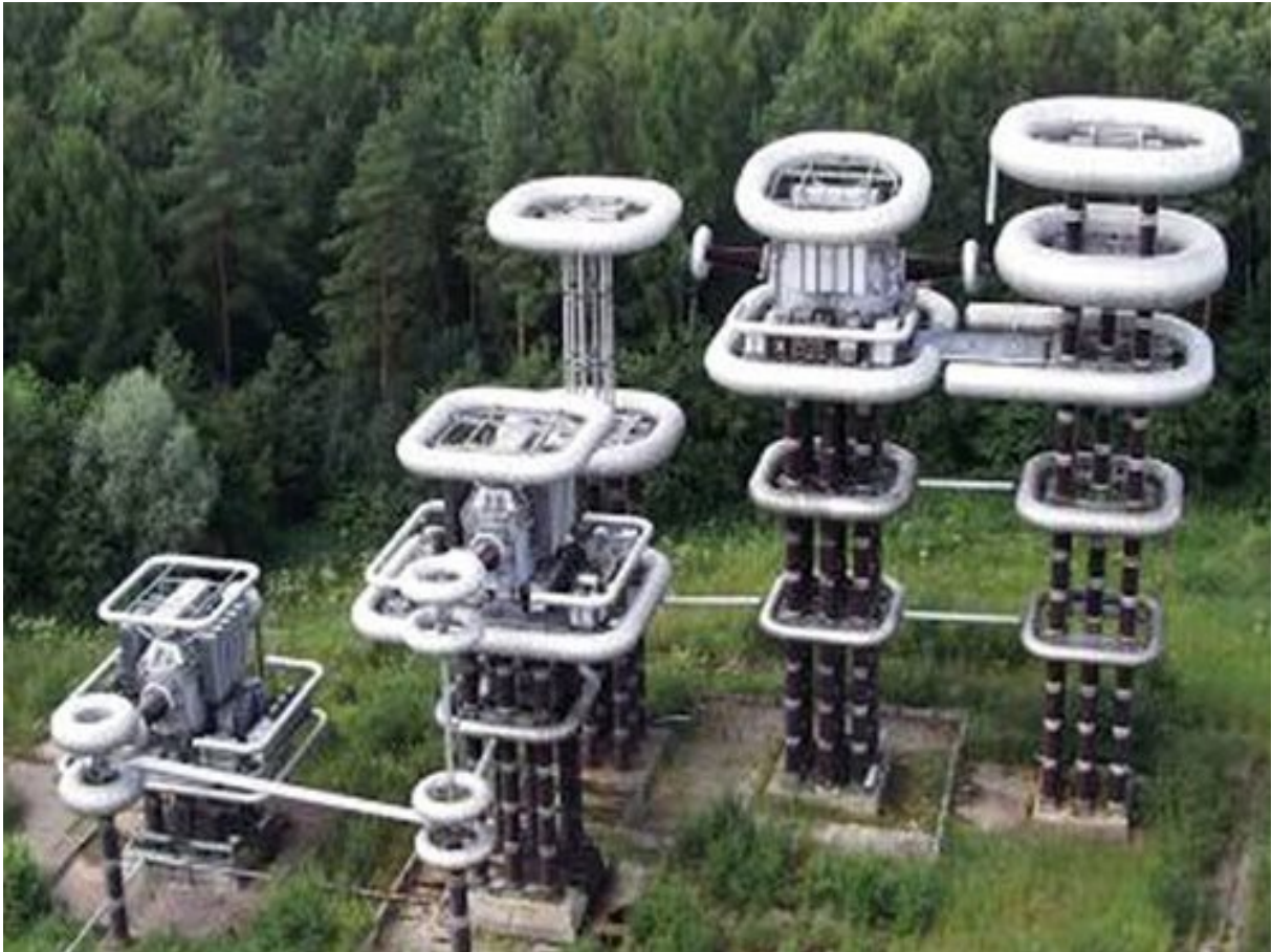
h.a.a.r.p.-installatie Alaska en Rusland