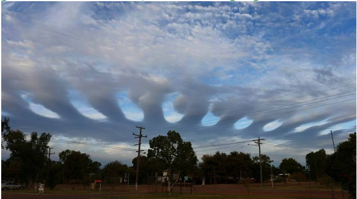
H.a.a.r.p.-bewolking boven Australië

Als laatste nog een citaat met een slotconclusie van het “Case orange report”: Het bestaan van programma’s ter beheersing van het klimaat kan niet meer ontkend worden. Ze