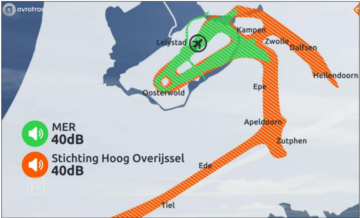
Figuur 1: Geluidscontouren vliegroutes - bron: uitzending EenVandaag 17 oktober 2017.