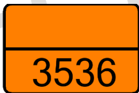
Oranje bord UN 3536

Ook hier zijn specifieke vervoersvoorschriften en van toepassing. In de regelgeving voor vervoer over de weg van gevaarlijke stoffen (het ADR) wordt in de bijzondere bepaling 389 aangegeven dat voldaan moet worden aan de eisen uit randnummer 2.2.9.1.7 a t/m g en dat voorzieningen aangebracht moeten zijn om overlading en ontlading te voorkomen. Verder geldt onder meer dat de batterijen in de laadeenheid deugdelijk bevestigd moeten worden. De laadeenheid moet op twee tegenover elkaar gelegen zijden voorzien zijn van oranje borden (de Kemmler-platen) en de zogeheten grote etiketten. Ook hier wordt uitdrukkelijk naar de vervoersregelgeving verwezen voor een volledig inzicht in de van toepassing zijnde regels.