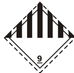
Groot etiket klasse 9