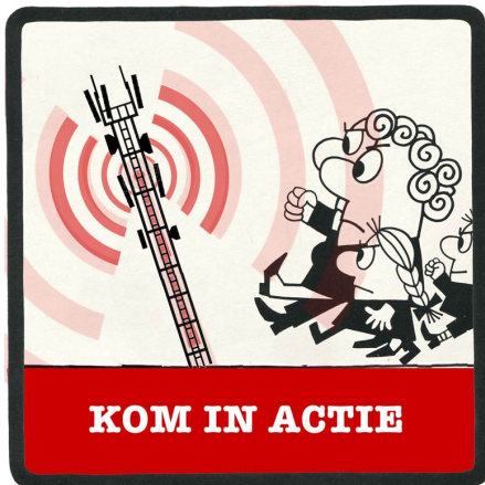
KOM IN ACTIE