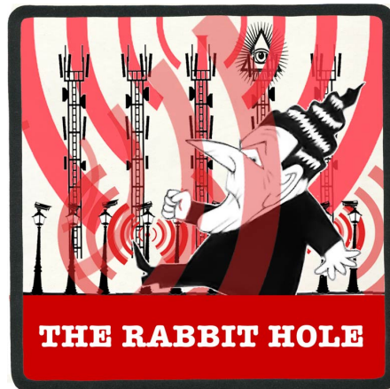
THE RABBIT HOLE

— 5gisnietoke.nl / 2019 / info & contact