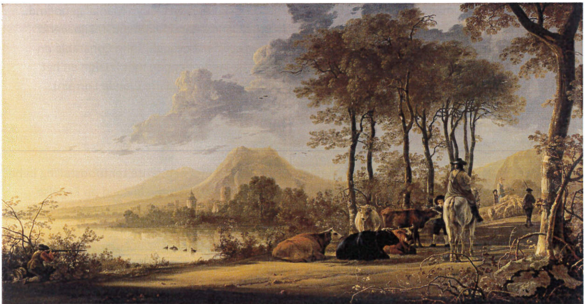
Aelbert Cuyp, Rivierlandschap met ruiter en vee , doek, 123 x 241 cm, Londen, National Gallery