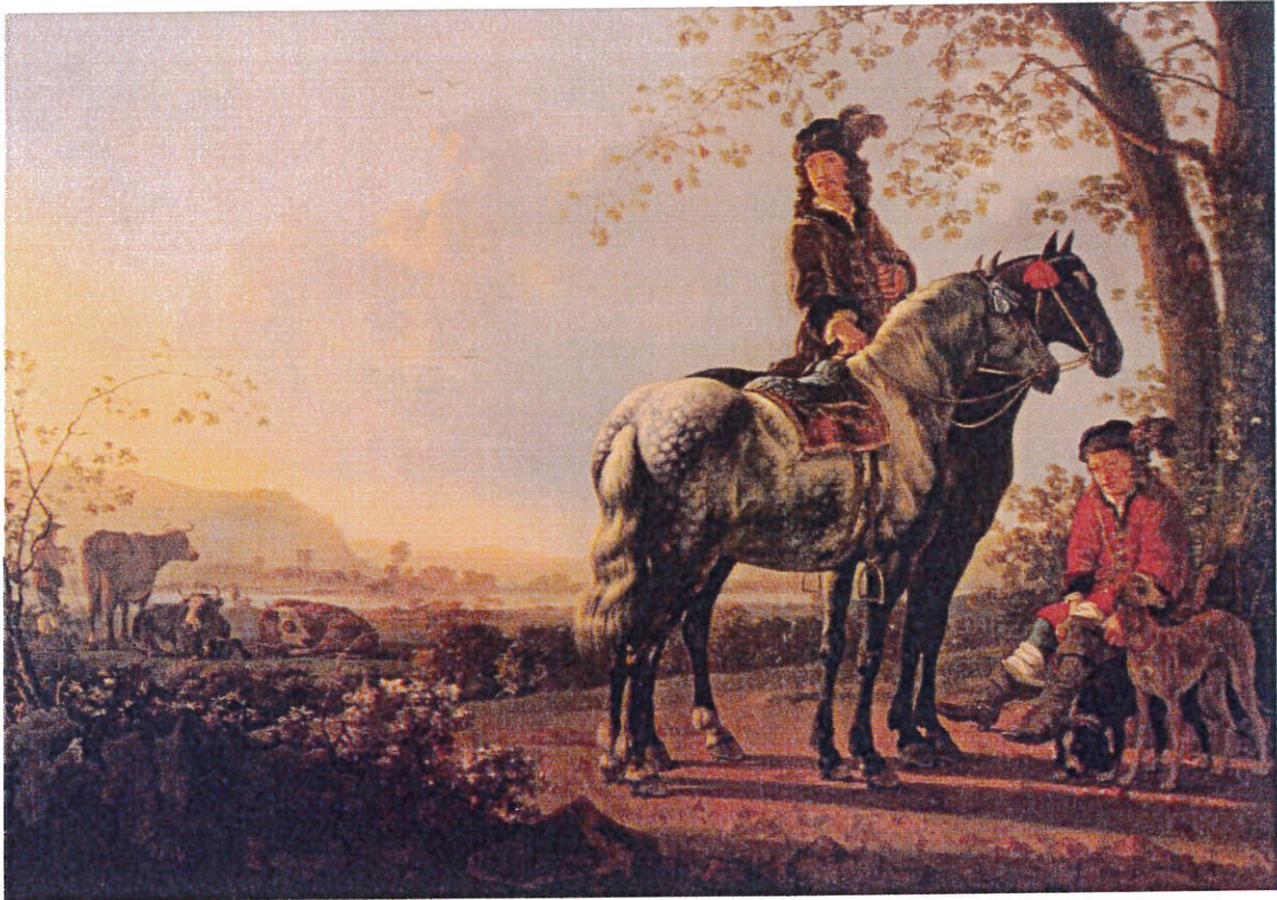
Aelbert Cuyp, Rustende ruiters in een landschap , doek, 116 x 168 cm, Dordrechts Museum