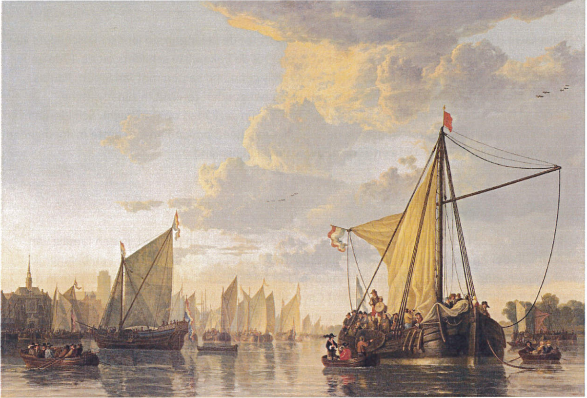
Aelbert Cuyp, De Maas bij Dordrecht , doek, 114,9 x 170,2 cm, Washington, National Gallery of Art