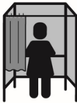
Schets van een stemhokje met gordijn

De namen en de nummers van de kandidaten staan in het overzicht van kandidaten dat de kiezer voor de verkiezingsdag thuis krijgt en dat tevens voor de kiezer in het stemhokje beschikbaar is. In dat overzicht van kandidaten staan ook de overige gegevens van de kandidaten die op het huidige stembiljet staan, te weten voorletter(s), (eventueel) roepnaam, gemeente of woonplaats en eventueel geslacht. Verder staat op het overzicht van kandidaten evenals op het stembiljet, bij elke partij het aantal kandidaten van die partij vermeld. 8 De kiezer raadpleegt het overzicht van kandidaten om na te gaan welk kandidaatnummer hoort bij de kandidaat op wie hij wil stemmen. De leden van het stembureau en andere kiezers die zich in het stemlokaal begeven moeten uiteraard niet kunnen zien welke keuze de kiezer maakt op het stembiljet en welke pagina van het overzicht van kandidaten de kiezer raadpleegt. Daarom wordt het stemhokje voorzien van een gordijn.