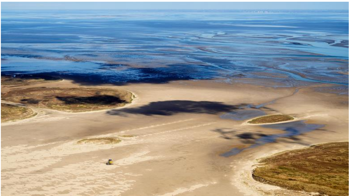
Vliehors Range vanuit het Zuid-Westen