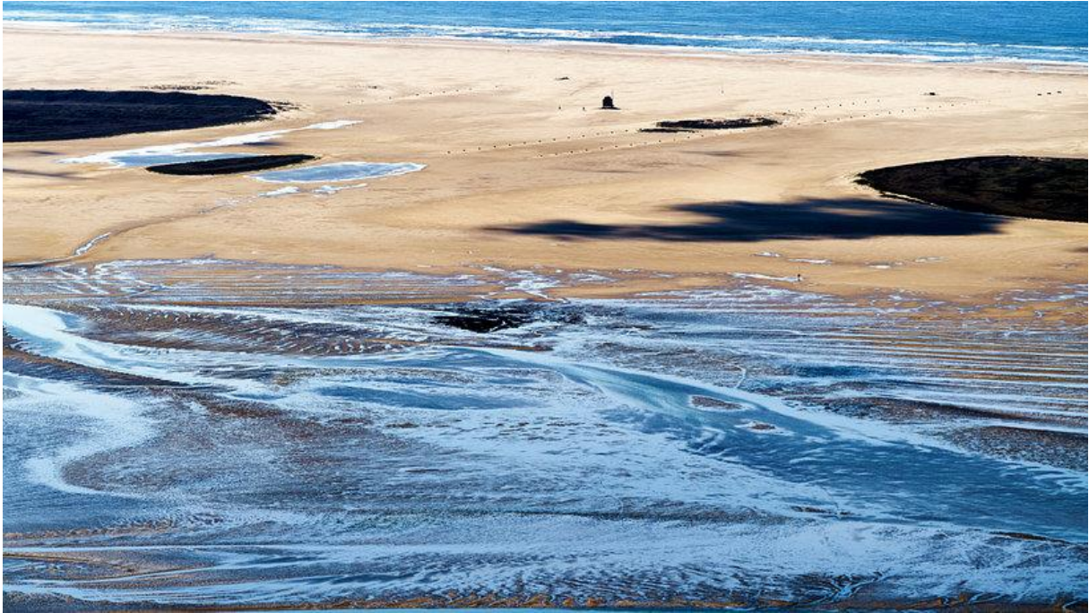
Vliehors Range vanuit het Zuid-Oosten