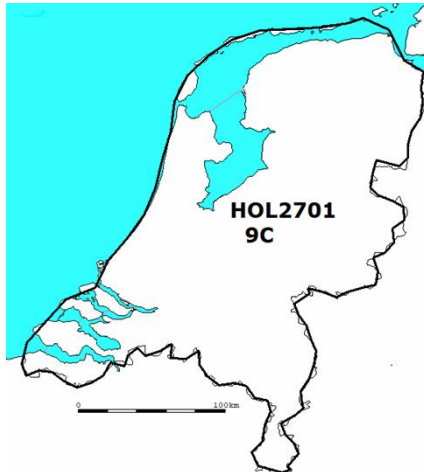
Figuur 2: Frequentieblok 9C.

Het landelijke frequentieblok 9C heeft de omtrek als beschreven in figuur 2.