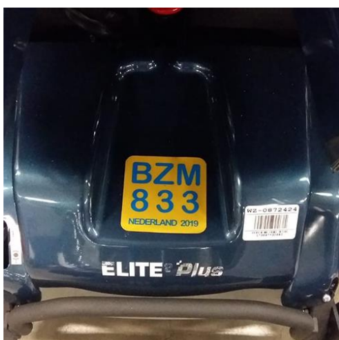
Sterling Elite Scootmobiel