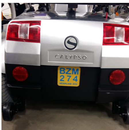
Sterling Calypso Scootmobiel