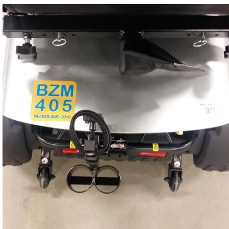
Pride Zolar: scootmobiel

Een aantal voorbeelden van gebruik en bevestiging van de verzekeringssticker