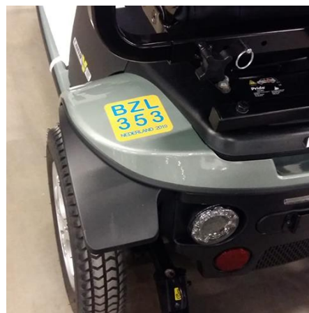
Pride Victory E Scootmobiel