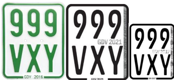
Figuur 3. Duitse verzekeringsplaten (2016) en met hologram in kentekenfolie (2021 en 2017 klein model)

Voor kleine elektrische voertuigen is bij de start een kleine verzekeringssticker geïntroduceerd, vanwege de kleine afmetingen en bijzondere kenmerken van het constructieve ontwerp van deze voertuigen. Deze verzekeringssticker bevat ook een hologram als extra beveiligingskenmerk, wat vervalsing bemoeilijkt. De ervaringen met deze verzekeringssticker op de Elektrokleinstfahrzeuge waren positief, waardoor sinds 1 maart 2021 deze sticker getest wordt als alternatief voor de conventionele verzekeringsplaten van snor- en bromfietsen. De proef duurt drie jaar en wordt daarna geëvalueerd 7 . Een sticker heeft voordelen boven een aluminiumplaat omdat de voertuigen ieder jaar een nieuwe verzekeringsplaat moeten krijgen. Ieder jaar een nieuwe sticker kost minder moeite en is beter voor het milieu. Het maakt het aanbrengen van de verzekeringsplaat eenvoudiger, duurzamer en goedkoper 8 . De verzekeringssticker voor Elektrokleinstfahrzeuge is met de afmetingen van 67 bij 55 millimeter 9 ook aanzienlijk kleiner dan de bestaande verzekeringsplaten die een maat hadden van 130 bij 101 millimeter, zij ook de onderstaande figuur.