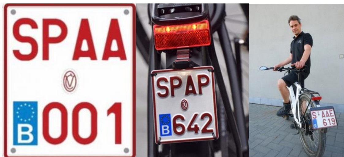
Figuur 4. Belgische kentekenplaat voor een speedpedelec

In Figuur 4 is een voorbeeld van een kentekenplaat voor een speedpedelec weergegeven.