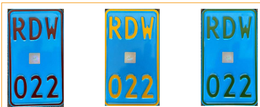
Figuur 1. Kleurencombinaties op basis van de uitvoering van een snorfietskentekenplaat (staande versie)

De huidige (Nederlandse) regelgeving staat alleen toe de kleuren wit, geel (motorvoertuigen en bromfietsen), lichtblauw (taxi's en snorfietsen) en donkerblauw (oldtimers), en lichtgroen (lichtgroen voor handelaarskentekenplaten) gebruikt mogen worden. Aanpassing van de regelgeving is een tijdrovend en intensief proces en moet minimaal een jaar vooruitlopend op invoeringsdatum worden afgerond. Dit heeft te maken met de tijdsintensieve activiteiten die daarvoor nodig zijn: technische analyse, exacte beschrijving van de kleur en de technische eigenschappen en de beschrijving van de testprotocollen en daarin gestelde eisen. Gezien de beoogde invoeringsdatum voor een verplicht kenteken op de Bijzondere Bromfietsen medio 2023 is de conclusie dat bij de bestaande foliekleuren moet worden aangesloten omdat een nieuwe kleur niet op tijd kan worden ingevoerd. Hoewel andere kleurencombinaties van folie en letters dus technisch mogelijk zijn moet omwille van de regelgeving toch gebruik worden gemaakt van de in de bestaande regelgeving vastgelegde foliekleuren. In Figuur 1 is een aantal mogelijke letterkleuren op basis van een snorfiets kentekenplaat in beeld gebracht.