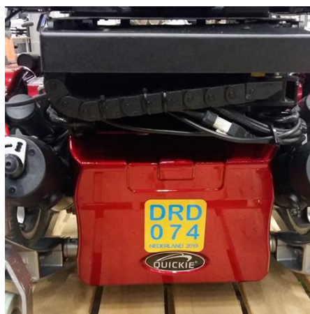
Quickie Salsa Elektronische rolstoel