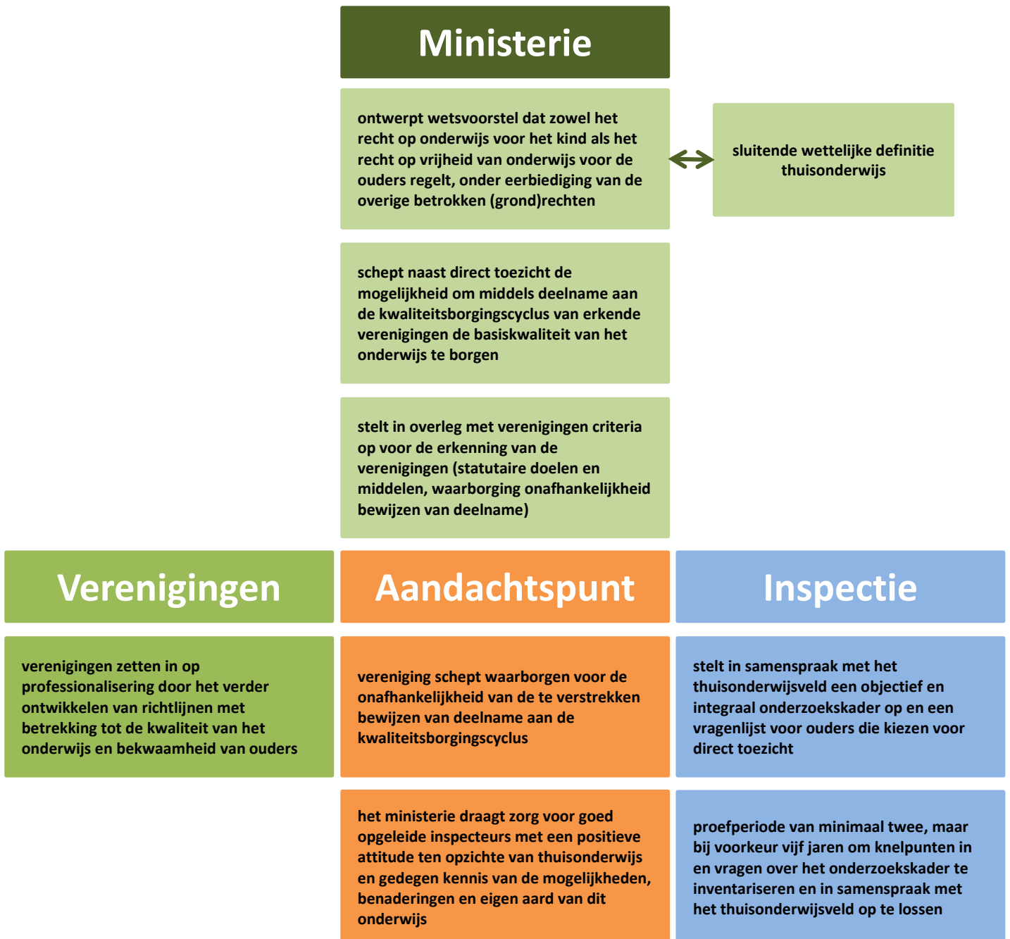
Afbeelding 2: stappen en aandachtspunten bij uitwerking rol erkende verenigingen bij toezicht