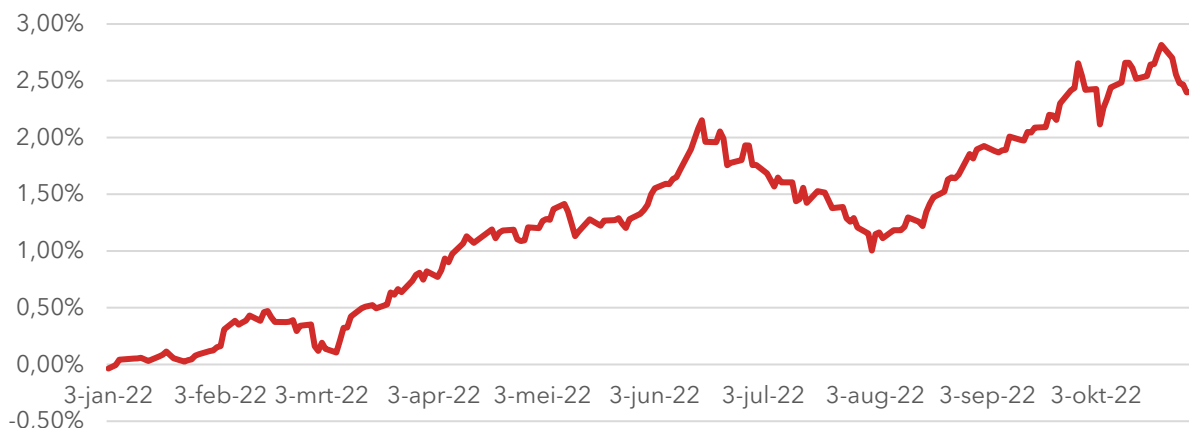
Figuur 2.2 Nederlandse kapitaalmarktrente is sinds eind december gestegen