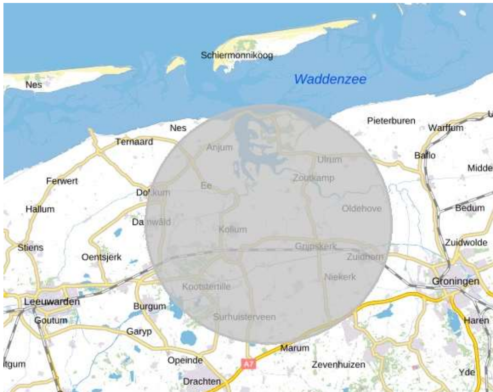
Figuur 1: Exclusiezone van 15 km rond het satellietgrondstation van Inmarsat in Burum ( 53^{\circ}17'03'' NB 6^{\circ}12'57'' OL).