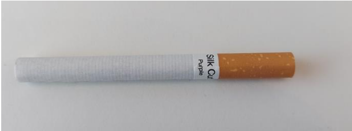
Fig. 1: Standaardsigaret met kurkpatroon filter naar Ierse vereisten