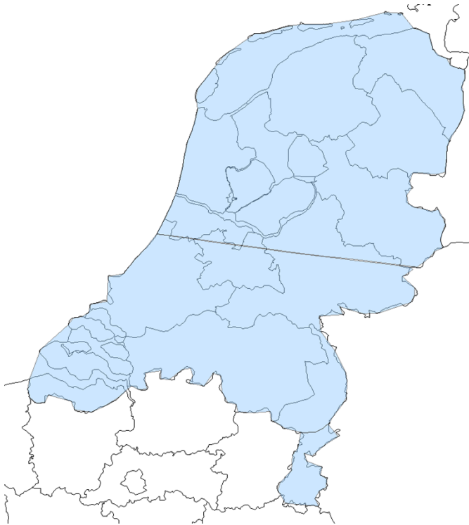
Figuur 2. Overzicht frequentieblok 11C, bestaande uit de

allotments HOL2201H, HOL2202H, HOL2203H. De punten waaruit de omtrek van elk allotment is opgebouwd zijn op een USB-stick opgenomen. Deze USB-stick maakt onderdeel uit van bijlage II.