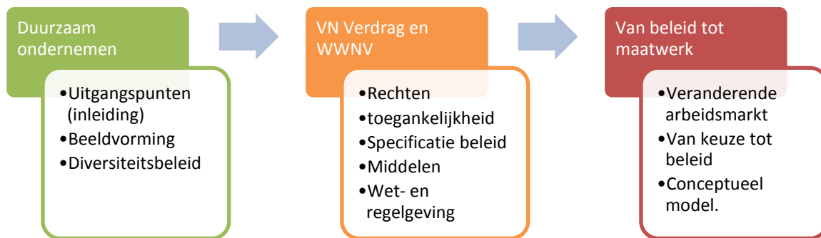
Figuur 1: De onderzoeksbouwstenen (Bianca Prins, 2012)

Om te komen tot effectief gehandicaptenbeleid is het van belang dat alle elementen kunnen worden getoetst aan zowel het interne beleid als de wet- en regelgeving. Om deze bouwstenen te vinden is het van groot belang om alle elementen eerst vorm te geven. Uiteindelijk gaan deze elementen op in een conceptueel model, waarmee voor elke organisatie een basis kan worden gelegd om gehandicaptenbeleid te ontwikkelen. De stappen die worden doorlopen zijn: