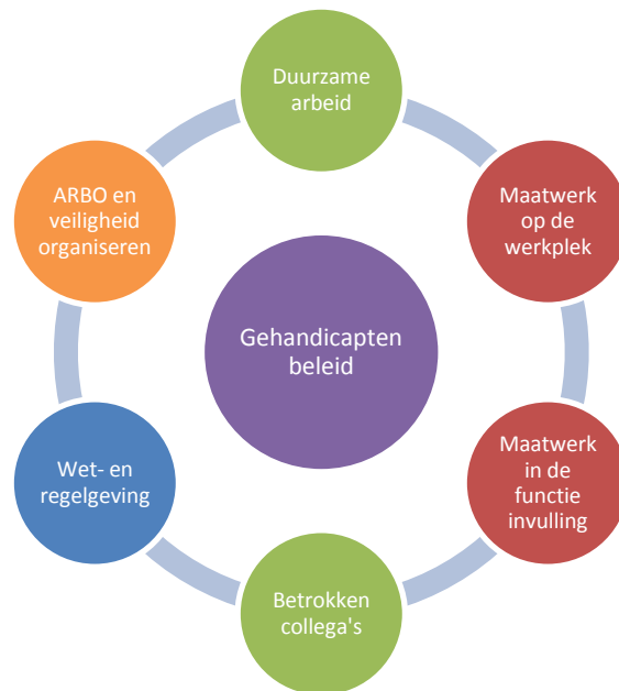
Figuur 4: Conceptueel model; bouwstenen als vangnet: (Bianca Prins, januari 2011.)

Het te ontwikkelen gehandicaptenbeleid vraagt om een individuele aanpak, op basis van een aantal stappen binnen het beleid. De eerste stap is de keuze voor duurzaam ondernemen, en geeft elke organisatie een eigen individuele afweging, in het vormen van het sociale aspect binnen duurzaam ondernemen. De volgende stappen binnen het circulair gepresenteerde proces, vragen om persoonlijke aandacht voor de medewerker met een beperking. Met als doel, het creëren van mogelijkheden, om deze medewerkers binnen de organisatie optimaal te faciliteren en daarmee kennis en talenten te benutten, ondersteund door dit model. De stappen binnen het conceptueel model zijn puntsgewijs uitgewerkt: