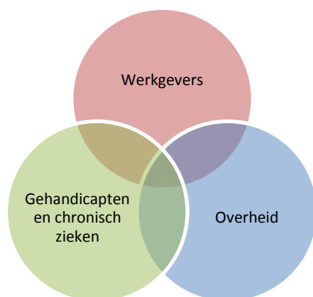
Figuur 2: Relatie tussen wetgeving en vrijwillige afspraken tussen werkgevers en overheid rondom Wajongers binnen de WWNV. (Bianca Prins, 2011)

Het ministerie van SZW verwacht dat werkgevers en Wajongers elkaar zullen vinden op de arbeidsmarkt naar aanleiding van de vergrijzende arbeidsmarkt en de verwachte tekorten op de arbeidsmarkt. (KCCO, 2011) Toch heeft de huidige wet- en regelgeving, in de vorm van de 'Nieuwe' Wajong, welke is ingevoerd in 2010, nog niet het gewenste resultaat behaald. (SZW, 2010; UWV, 2011) Sinds de invoering van de 'Nieuwe Wajong' is het aantal werkgevers met een Wajonger in dienst slechts met 0.4% gegroeid. Dit is onderzocht door het UWV in 2011, en opgenomen in de Wajongmonitor. (UWV 2011) Uit dat zelfde onderzoek bleek ook dat "Het aantal werkende Wajongers in 2010 uit kwam op 24,6%. Van de Wajongers die bij een reguliere werkgever werkten, waren zij het meest in dienst bij de bedrijfstakken 'Winkelbedrijf en Groothandel' (22%), 'Gezondheid' (18%) 'Overig bedrijf en beroep' (12%, met name horeca en schoonmaakbranche) en 'Industrie sec' (10%). In deze vier sectoren werkt bijna 2/3 van alle Wajongers die bij een reguliere werkgever werken." (UWV, 2011, p. 119) Op basis van deze cijfers en beroepsgroepen kan men concluderen dat de groep werkende Wajongers voornamelijk uit laag geschoolde Wajongers bestaat, mede omdat dit cijfer vrijwel gelijk is aan het aantal Wajongers dat binnen de Wet Sociale Werkvoorziening (WSW) werkzaam is. (UWV, 2011)