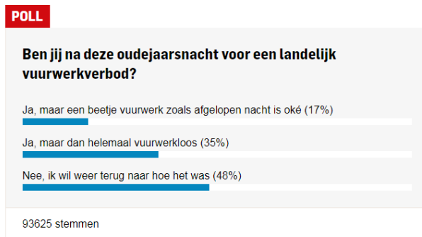
Figuur 2 Uitslag van AD-poll d.d. 01-01-2021

En zo zijn er meer polls, waaruit blijkt dat de meeste mensen het zelf afsteken van consumentenvuurwerk willen behouden. Op 01-01-2021 vulden bijna 100.000 mensen een poll van het AD in, waarvan 65% graag wil dat het zelf afsteken van consumentenvuurwerk mogelijk dient te blijven (zie Fig.2). Dat is een ander beeld dan de uitslagen van de polls, die gepresenteerd worden door bijvoorbeeld het NOS-journaal en EenVandaag.