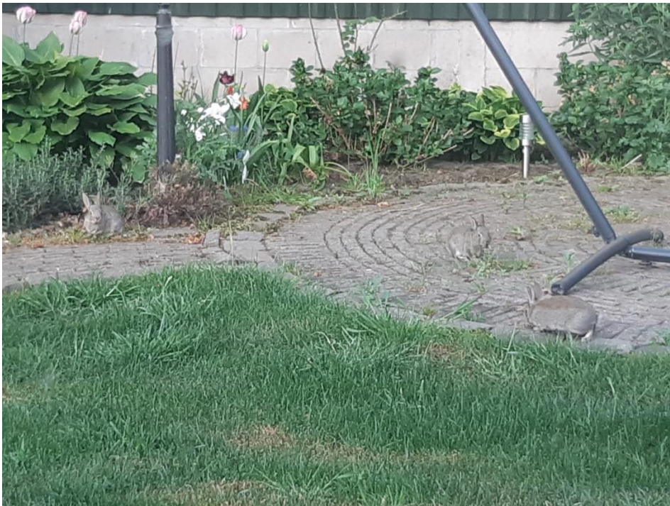
Figuur 2: Jonge konijnen in eigen tuin tegen de stal 12-05-2022

Omdat wij het wel belangrijk vinden dat er inheemse soorten blijven bestaan doen wij ook ons uiterste best om de konijnen populatie een handje te helpen. Zo vangen we het gehele jaar door konijnen om ze te enten tegen de veelvoorkomende ziektes om zo de populatie ook beter weerbaar te maken. Ook weet elke jager dat de konijnenstand buitengewoon snel kan herstellen van een mogelijke ziekte uitbraak onder soortgenoten. Het gevolg hiervan zijn grote schades aan landbouwgewassen. De keuze tot afschot bij schade dient aan de jager te zijn. Omdat hij de populatie in combinatie met schade het best in zicht heeft.