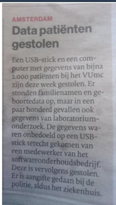
Figuur 2: Incidenten

Met welk van de volgende vormen van datalekken, waarbij klantgegevens of andere privacygevoelige gegevens betrokken waren, heeft uw organisatie in 2016 mee te maken tot zover?