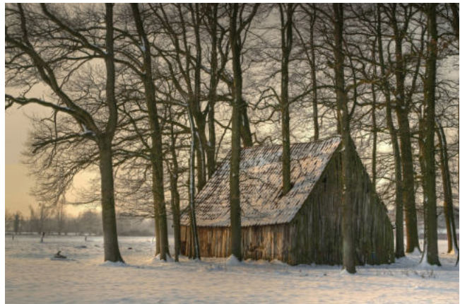
afbeelding van psychische doorwoekering van gezond verstand